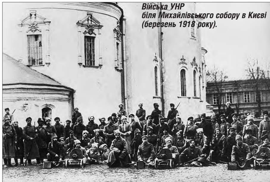
Війська УНР біля Михайлівського собору в Києві (березень 1918 року).

На тому історичному засіданні вирішують «почепити національний прапор на будинкові міської думи на тим місті, де був раніше царський вензель». Історичними стали й слова Грушевського, який після 100-тисячної україн-