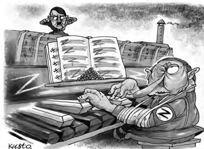
Путін грас... Вагнера.